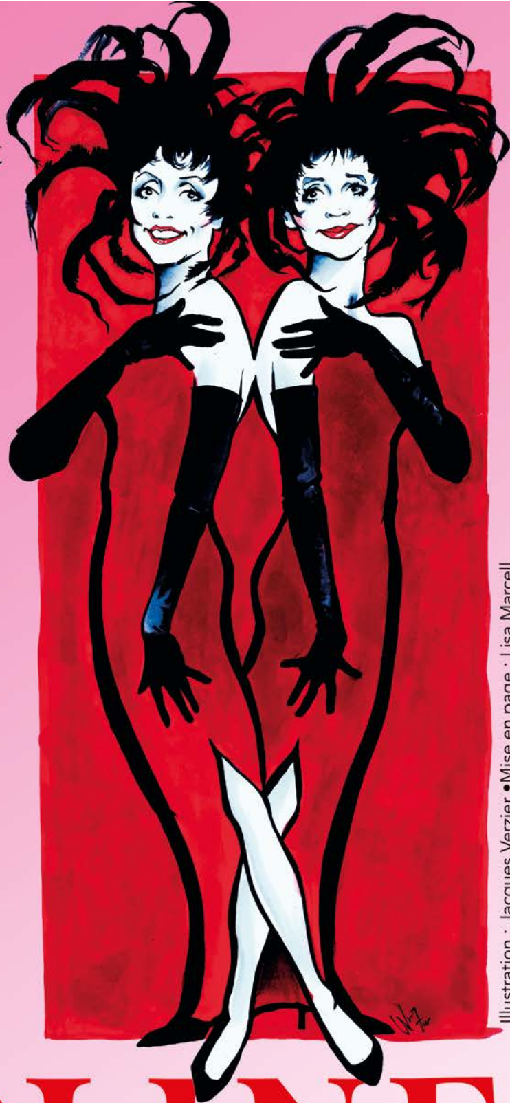
Illustration : Jacques Verzier • Mise en page : Lisa Marcell

lesenfantsduparadis.fr | 01 42 46 03 63 | 34 rue Richer - 75009 Paris